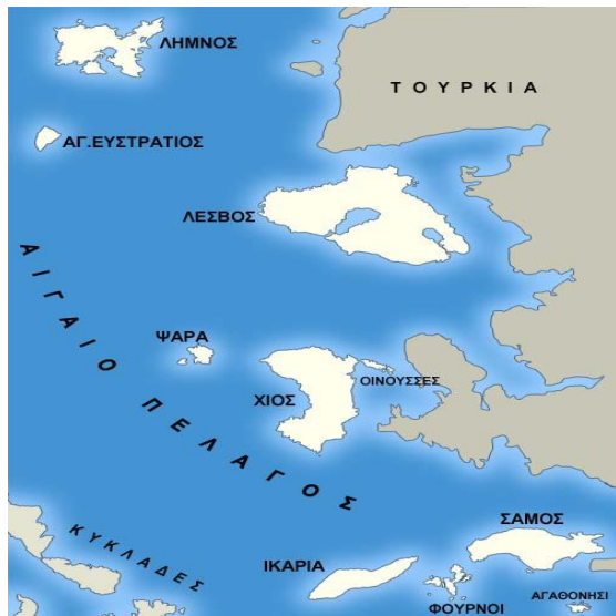
Νησιά Β. Αιγαίου